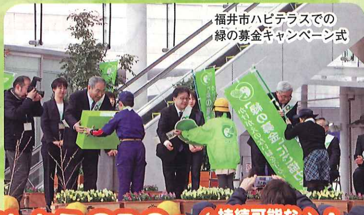
福井市ハピテラスでの 緑の募金キャンペーン式