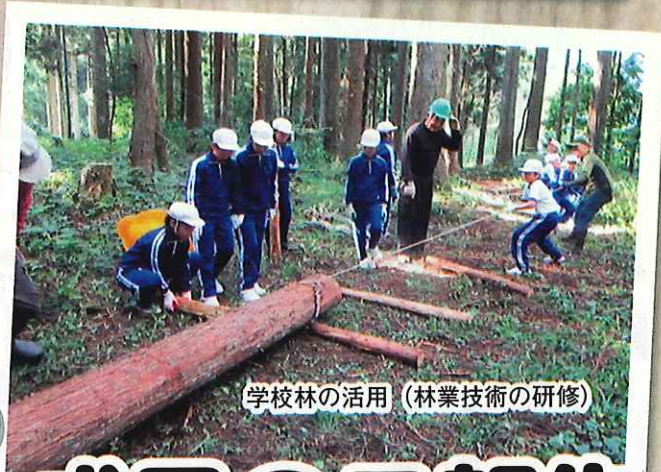
学校林の活用 (林業技術の研修)