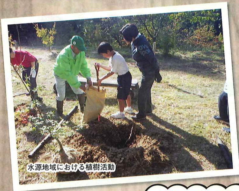
水源地域における植樹活動