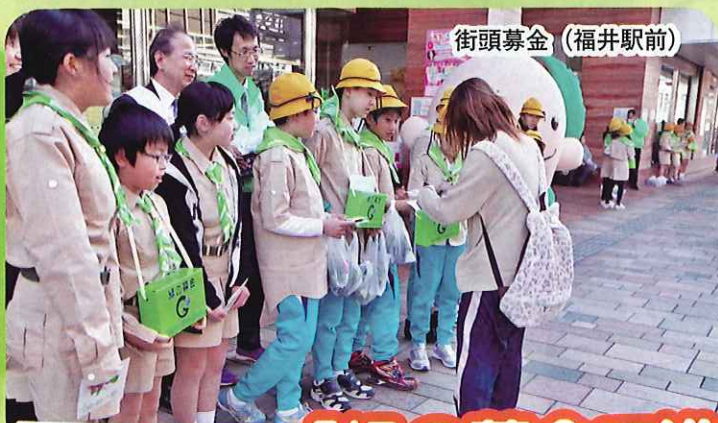
街頭募金（福井駅前）