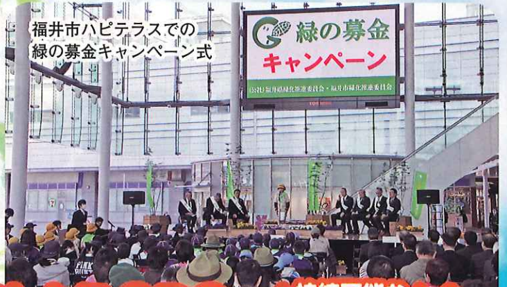
福井市ハピテラスでの 緑の募金キャンペーン式