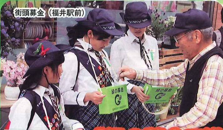
街頭募金（福井駅前）