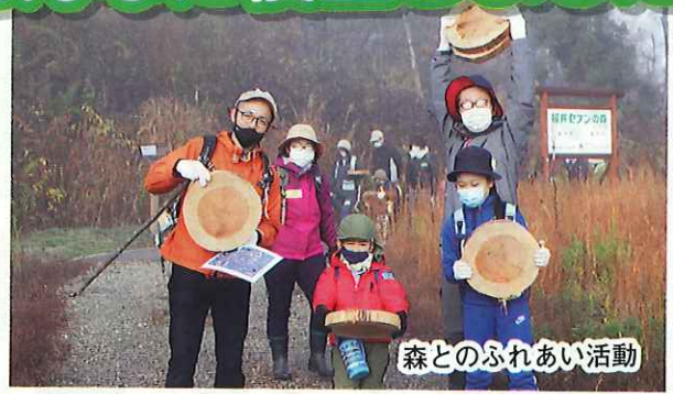
森とのふれあい活動