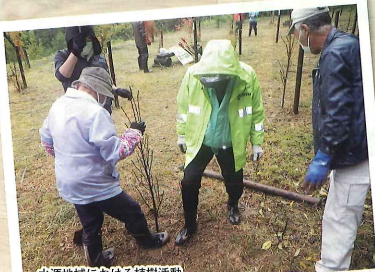
水源地域における植樹活動